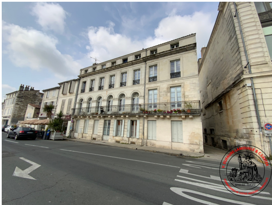
2. Façade côté Quai de la République (29/06/2023 11:18:42)

Précision verticale=7.08m, Précision horizontale=6.50m, Heure GMT=2023-06-29 09:18:08.