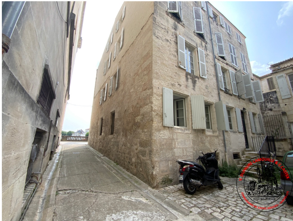
1. Façade du 20 quai de la République (29/06/2023 11:18:10)

GPS : Latitude=45.74672, Longitude=-0.63082, Altitude=5.86 m, Angle:13.40°